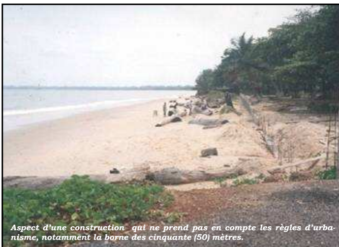
Aspect d'une construction qui ne prend pas en compte les règles d'urbanisme, notamment la borne des cinquante (50) mètres.