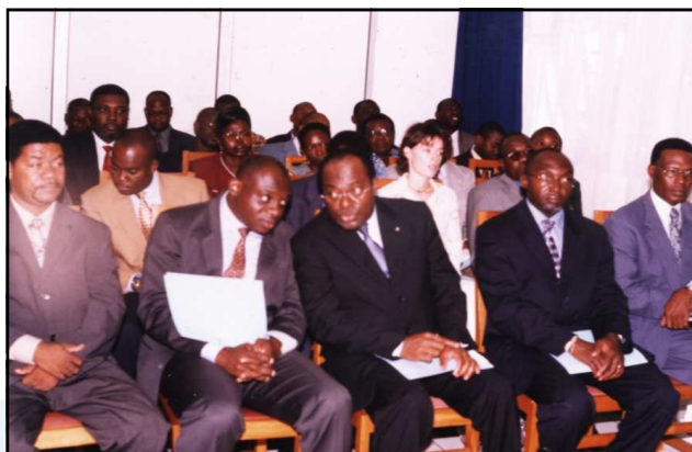
Une vue des officiels lors de l'atelier sur la gestion des données océanographiques

Il nous revient donc, à tous qui sommes partenaires de cette aventure, de mieux structurer